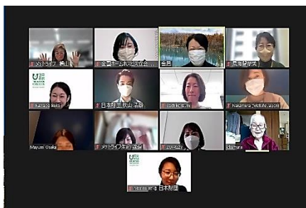
〔オンライン聞き取り〕