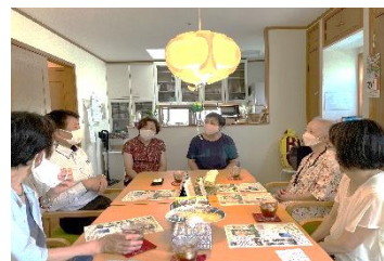
〔セ・ラ・ヴィ！にて関東支部意見交換会〕