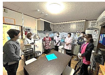
〔もりの家スタッフ：ミニ研修〕